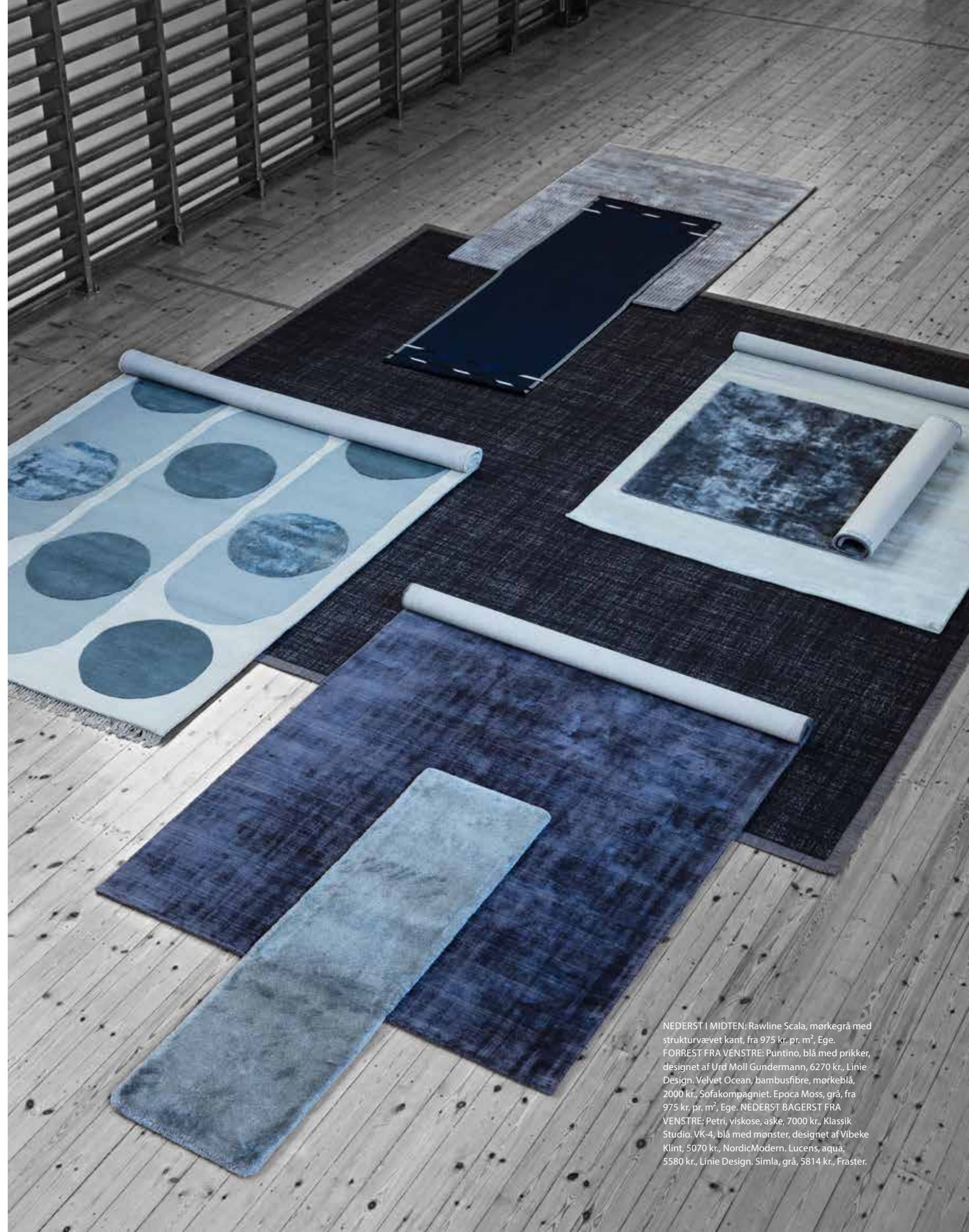
NEDERST I MIDTEN: Rawline Scala, mørkegrå med strukturvævet kant, fra 975 kr. pr. m 2 , Ege. FORRÆST FRA VENSTRE: Puntino, blå med prikker, designet af Urd Moll Gundermann, 6270 kr., Linie Design. Velvet Ocean, bambusfibre, mørkeblå, 2000 kr., Sofakompagniet. Epoca Moss, grå, fra 975 kr. pr. m 2 , Ege. NEDERST BAGERST FRA VENSTRE: Petri, viskose, aske, 7000 kr., Klassik Studio. VK-4, blå med mønster, designet af Vibeke Klint, 5070 kr., NordicModern. Lucens, aqua, 5580 kr., Linie Design. Simla, grå, 5814 kr., Fraster.